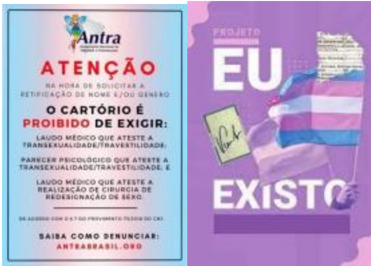
(Figura 1. Cartilha ANTRA, 2018) (Figura 2. Cartilha ANTRA, 2018)

Informando que os cartórios são obrigados a prestar os seus serviços e não podem recusar-se a fazê-lo, a modificação do registro civil de nascimento é preciso ser realizado, não pode alegar falta de conhecimento e não realizar, caso ocorra algum desses cenários, é necessário que notifique imediatamente e informe as autoridades competentes responsáveis de realizar inspeções de cartórios, como as corregedorias dos tribunais de justiça, a Defensoria Pública atua no sistema judiciário e o Conselho Nacional de Justiça atua em nível nacional. 63