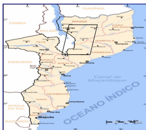
Figura 1 - Mapa das áreas estudadas pela Missão Embrapa

Assim, o estudo de nome "Solos e Potencialidades Agrícolas em Moçambique: o caso da região do Corredor de Nacala" (2010), redigido pela equipe técnica da Embrapa e coordenado pela Agência Brasileira de Cooperação (ABC) traz análises e dados sobre as condições locais visando o desenvolvimento agrícola e rural moçambicano. As áreas que se caracterizam como foco deste estudo — vislumbradas no mapa abaixo — foram segmentadas posteriormente em divisões provinciais e sua análise se deu por funcionalidades como, por exemplo, a utilização do solo, o índice pluviométrico, a vegetação local, entre outros.