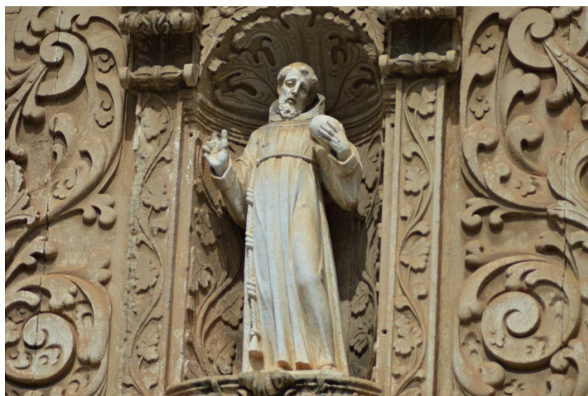
Imagem 2 – Foto de escultura de São Francisco de Assis, localizada na Igreja Ordem Terceira de São Francisco, Salvador.

Na entrada da Ordem 3 a de São Francisco, localizada no centro histórico da cidade de Salvador, contando com uma belíssima arquitetura, cercada de detalhes barrocos e inúmeros simbolismos, vemos na sua fachada em destaque a figura de São Francisco de Assis (Imagem